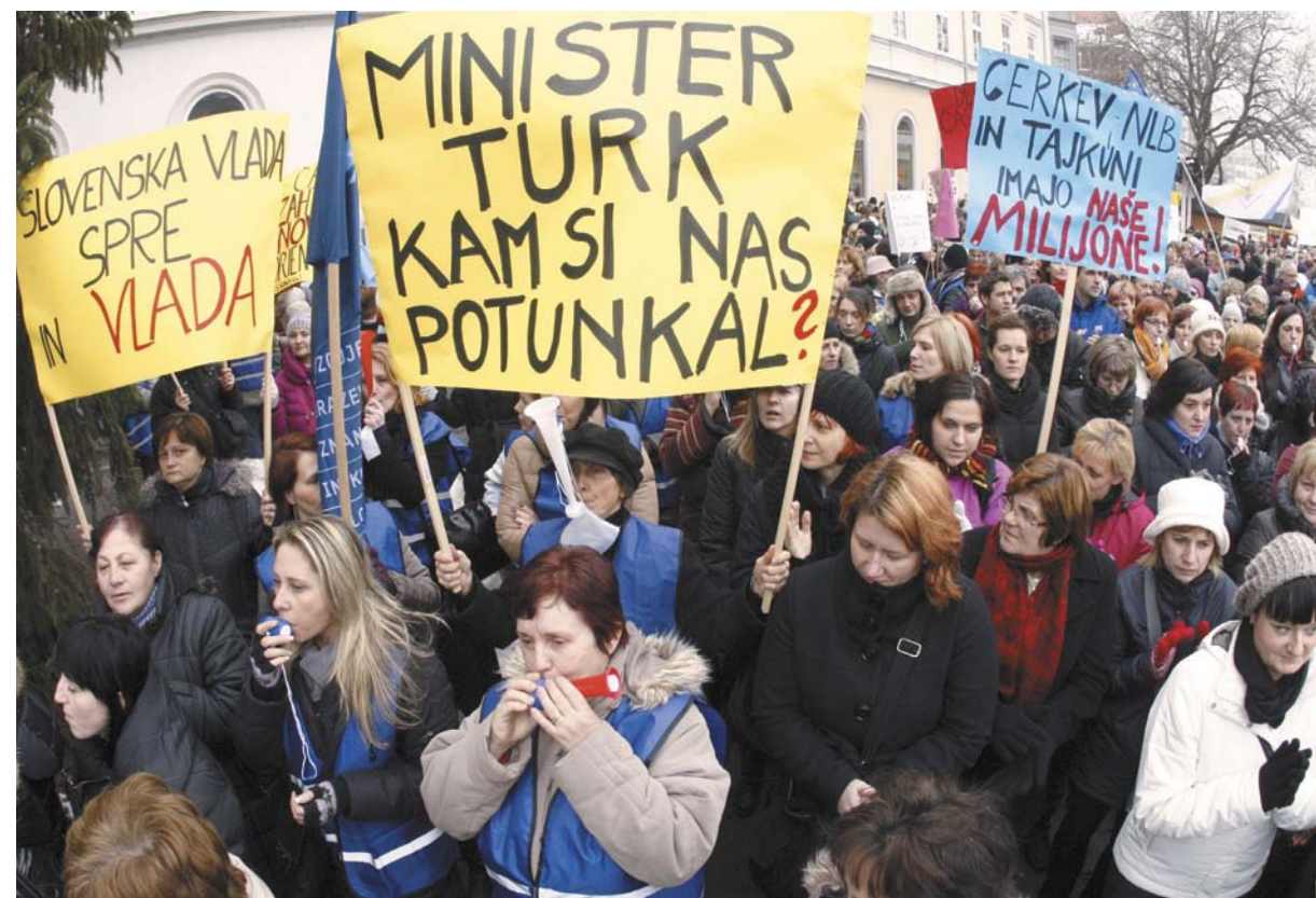
Maribor: Ob 12.05 protestni shod. (Sašo Bizjak)