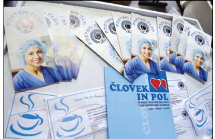
Dogodek »Imaš čas za kavico« v SB Šempeter pri Novi Gorici, 19.10.2011