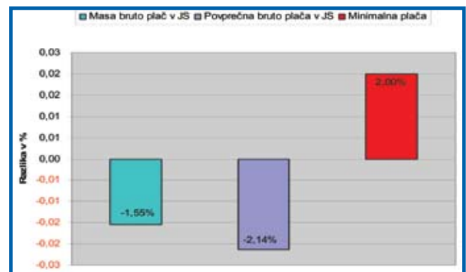
Graf 1: Razlike v povečanju/zmanjšanju mase bruto plač, povprečne bruto plače v javnem sektorju in minimalne plače za leti 2011 in 2012.

Zadnje zvišanje minimalne plače na 783,66 € pa je znesek minimalne plače med zneskoma osnovnih plač petnajstega in šestnajstega plačnega razreda (Tabela 2, stolpec D).