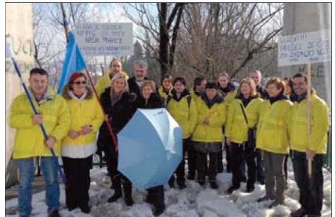
Udeleženci shoda v Novem mestu