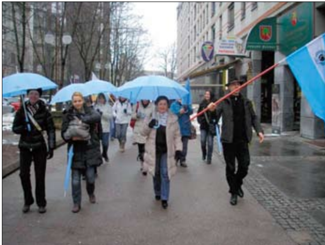
Udeleženci stavke z Jesenic