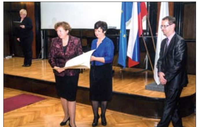
Priznanje sindikatu od Zbornice-Zveze

Tožba je vložena na Delovno in socialno sodišče v Ljubljani in to samo za člane našega sindikata.