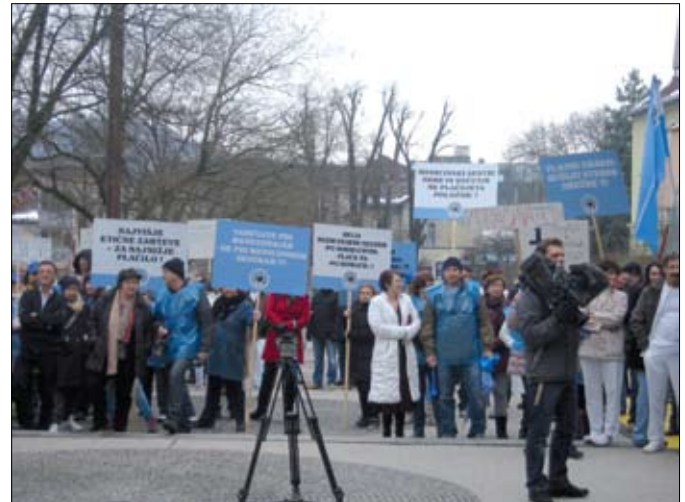
Protestni shod zaposlenih UKC Ljubljana

zaposlenih na našem področju med 250 in 300 naših predstavnic in predstavnikov. V medijih smo se lahko prepoznali po modrih zastavah, maloštevilnih transparentih in modrih dežnikih (mimogrede, teh smo kot stavkovni simbol razdelili ob tej in prejšnji stavki veliko več). Razlogi naše neaktivnosti so bili podrobno navedeni na nedavni seji republiškega odbora sindikata, ki je razširjeno vodstvo sindikata med obema skupščinama.