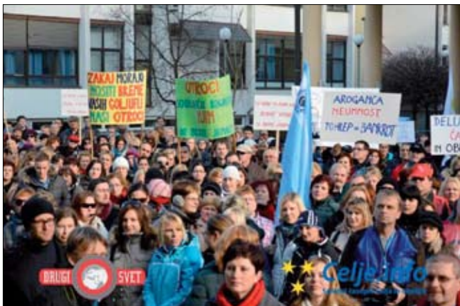
Protestni shod v Celju

V trenutni situaciji se nihče ne spršaše kako naj še izvajamo kakovostno in varno zdravstveno nego.